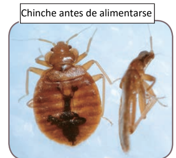
Chinche antes de alimentarse

Si usted tiene miedo de tener los chinches de cama, debe inspeccionar todos los lugares mencionados previamente por señales de los chinches; incluyendo manchas fecales, piel mudada, racimos de huevos e insectos vivos.