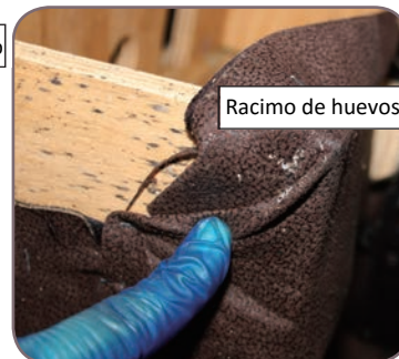
Racimo de huevos